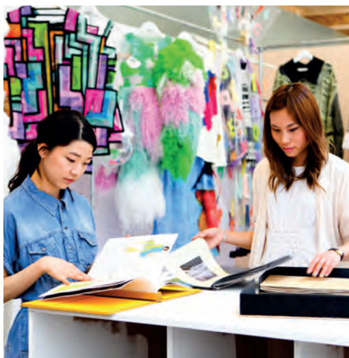
Посетители Летнего Шоу 2013 в Central Saint Martins (Сентрал Сент Мартинс) рассматривают портфолио.