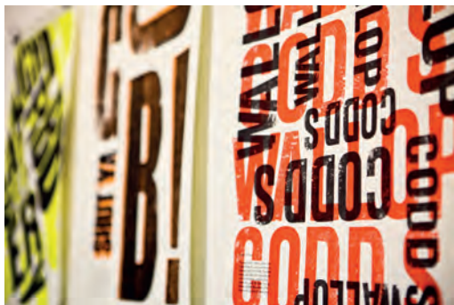
Летнее шоу 2013 г., графический дизайн, London College of Communication