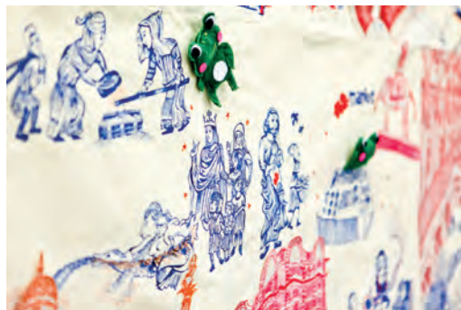
Sin Lee BA (Hons) Illustration 2013 Camberwell College of Arts